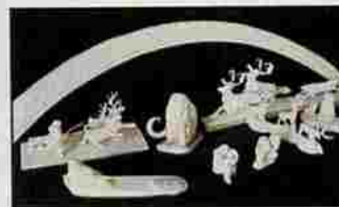
Oggetti di avorio di mammut prodotti in Siberia. Vengono venduti a Mosca a circa 700 mila lire.

mo il fiume, sul ciglio erboso marmotte vigili ci guardano passare: qui l'uomo non è ancora un nemico. Più avanti gli alci pascolano nella bassa vegetazione e solo quando il forte vento porta il nostro odore, gli animali si allontanano al piccolo trotto, maestosi e solenni. Le rive intanto si fanno sempre più alte, imponenti zolle di terra erosa scompaiono inghiottite dalle tumultuose acque. Pur essendo nel cuore dell'estate, la temperatura non supera i 10 gradi e il sole non scalda abbastanza. Appena fermi ci assalgono sciami di zanzare, una vera tortura. Tutto ciò che vive, viene terrorizzato dal loro diabolico ronzio. Pungono attraverso i vestiti e il nostro nauseabondo repellente riesce a tenerle a distanza solo per poco tempo. L'unica difesa efficace è il vento che le fa sparire.