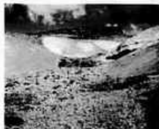
LA SORGENTE Qui sopra, un'immagine della sorgente del Rio delle Amazzoni

Società Geografica di Lima ha definito il punto preciso delle sorgenti del fiume. Il luogo esatto si trova a 5.179 metri di quota in prossimità del nevado Quehuisha. «Il termine "Nevado" non deve far pensare a un ghiacciaio. È un'area ricoperta da permafrost, un suolo misto a ghiaccio che ricopre una parte della montagna», ha spiegato Palkiewicz nel commentare la scoperta.