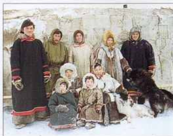
Nelle foto, tipiche popolazioni di Krasnojarsk, un villaggio a 3000 chilometri ad Est di Mosca. Qui sorge il più importante centro dell'industria bellica e spaziale sovietica, severamente chiuso agli stranieri. La spedizione italiana è stata la prima alla quale è stato concesso di entrarvi.

gettiamo trance di pesce congelato, tagliato con la stessa accetta usata per spaccare la legna.