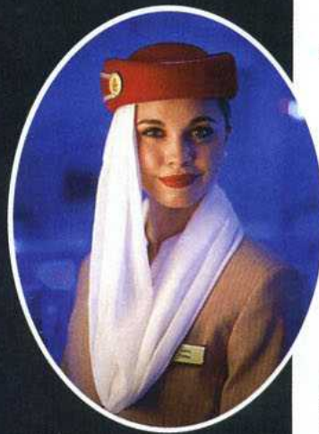
Stewardesa dubajskich linii lotniczych Emirates

Burdż Chalifa jest obecnie najwyższym wieżowcem na świecie. Budynek ma 828 m, czyli prawie 3,5 razy więcej niż Pałac Kultury i Nauki w Warszawie