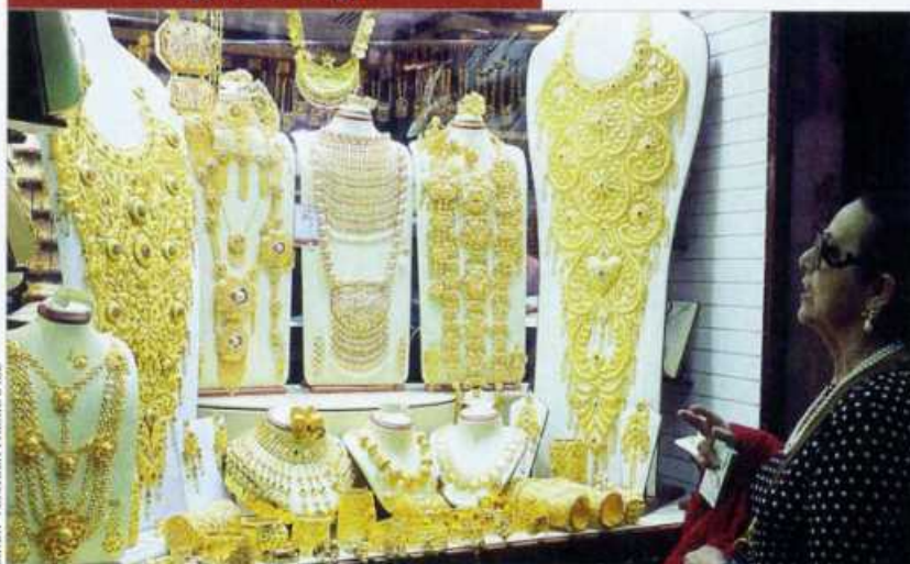
Jedna z witryn na Gold Souk, dubajskim bazarze złota, gdzie codziennie sprzedaje się około 200 kg tego cennego kruszcu