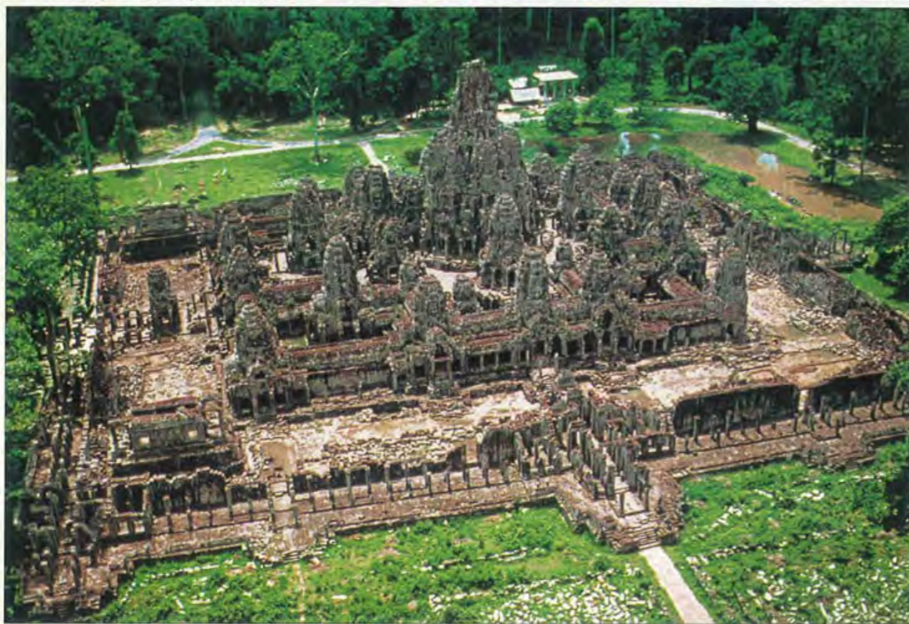
ВВЕРХУ: ДОРОГА ВОИНОВ — ГЛАВНЫЙ ВХОД В ГОРОД-КРЕПОСТЬ АНГОР-ТХОМ. СПРАВА: ЧЕТЫРЕХГЛАВНЫЙ БАЙОН — ХРАМ-ПАМЯТНИК КОРОЛЮ ДЖАЙВАРМАНУ VII — ОСТРОВ В МОРЕ ДЖУНГЛЕЙ. СПРАВА: РАЗВАЛИНЫ БАЙОНА С ПОЛУРАЗРУШЕННЫМИ ЛИКАМИ СТРОИТЕЛЯ ХРАМА — ДЖАЙВАРМАНА VII

И все-таки вандалы не могут унести с собой храмы. Наиболее известный и лучше всего сохранившийся из них — Ангор-Ват. На возведение этого классического