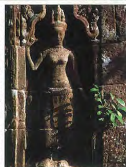
ТА ПРОМ — ОДИН ИЗ ДРЕВНЕЙШИХ ХРАМОВ АНГОРА, И СЕГОДНЯ ОСТАЮЩИЙСЯ ВО ВЛАСТИ ДЖУНГЛЕЙ. ЭТО — ФАНТАСТИЧЕСКОЕ СПЛЕТЕНИЕ ЧЕРНЫХ КАМНЕЙ И ЯДОВИТО-ЗЕЛЕННЫХ ДЖУНГЛЕЙ. СПРАВА: СТАТУА АПСАРЫ — НЕБЕСНОЙ ТАНЦОВЩИЦЫ В «ХРАМЕ ЖЕНЩИН» БАНТЕЙ СРЕЕ

Сегодня такая точка зрения получает все большее признание. Может быть, в самом деле лучше не нарушать гармоничное равновесие и таинственную атмосферу Ангкора, которые складывались на протяжении веков? ■