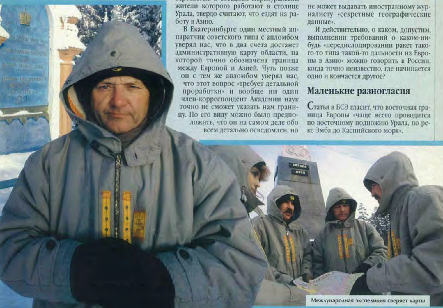
Международная экспедиция сверяет карты

А в учебниках географии русских детей написано, что Эмба находится в сотнях километров к востоку от Урала.