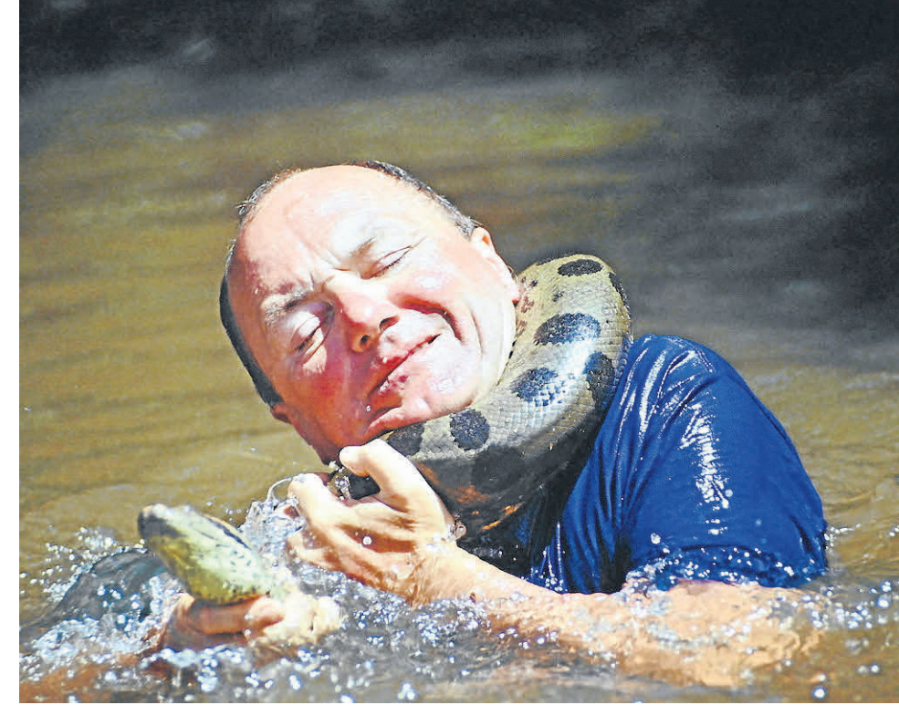
Jacek Pałkiewicz to polski dziennikarz i podróżnik, odkrywca źródła Amazonki. Wychował się w Elku.

Nie miałbym żadnej obiekcji, aby podkreślić jej autentyzm. Byłem tam w ubiegłym roku i przyznaję, że to wspaniały, kojący duszę azyl, gdzie nie brak zachwycających krajobrazów, malowniczych jezior i niesamowitego, wyciszającego spokoju, bo czas płynie tu znacznie wolniej niż gdzie indziej. Ktoś mógłby zapytać, dlaczego mając takie atuty Podlasie nie potrafi się sprzedać. Moja odpowiedź jest taka, że Polacy mają nieraz silne karty, nigdy nie potrafili się wypromować, nasze suk-