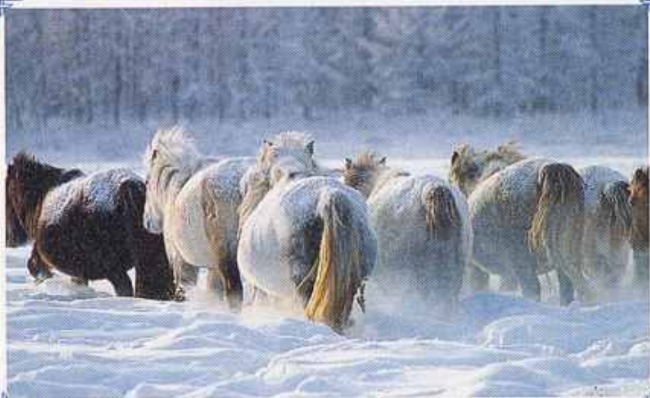
Cavalli jakuti, cavalli di sempre: nel loro cuore i pensieri d'amore di creature divine.

breve estate siberiana potrebbe essere un periodo di benessere se non ci fossero zanzare, moscerini e tafani, grandi nemici di tutti gli esseri viventi in Siberia. Ma in settembre arriva la neve e gli insetti spariscono..