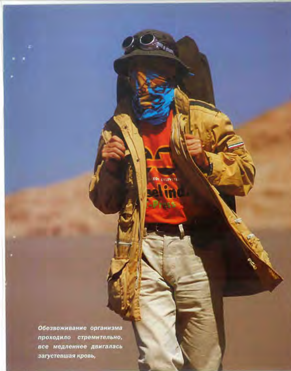
Обезвоживание организма проходило стремительно, все медленнее двигалась загустевшая кровь,

Песчаные бури всегда уносили много человеческих жизней. Самая большая трагедия случилась в 525 году н. э., когда в пустыне в Запад-