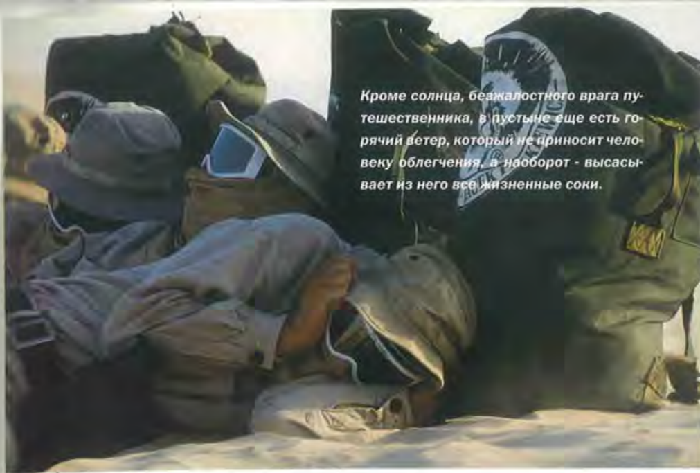
Кроме солнца, безжалостного врага путешественника, в пустыне еще есть горячий ветер, который не приносит человеку облегчения, а наоборот - высасывает из него все жизненные соки.