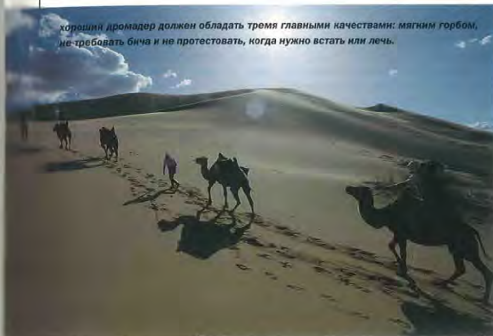
Хороший дромадер должен обладать тремя главными качествами: мягким горбом, не требовать бича и не протестовать, когда нужно встать или лечь.

и о способах ограничивать обезвоживание организма.