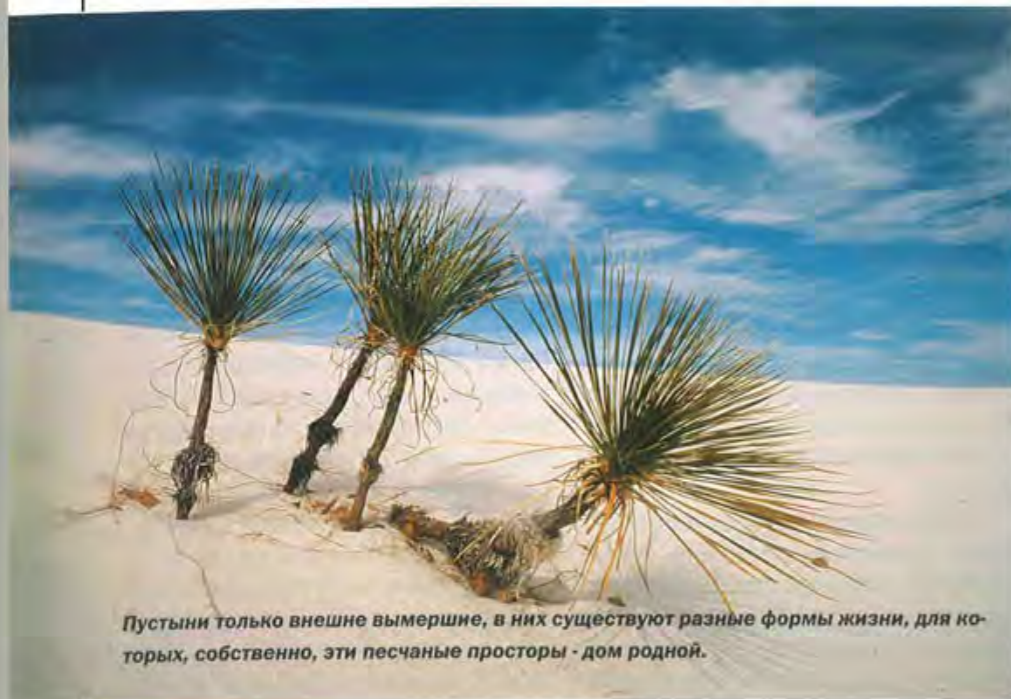
Пустыни только внешне вымершие, в них существуют разные формы жизни, для которых, собственно, эти песчаные просторы - дом родной.