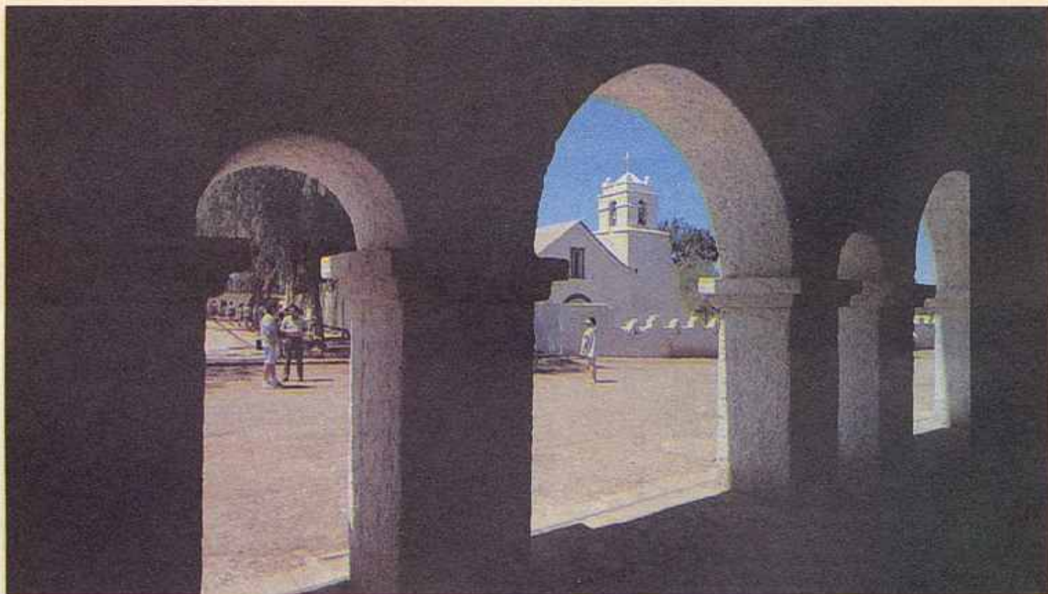
Сан-Педро-де-Атакама – подлинный оазис в пустыне.